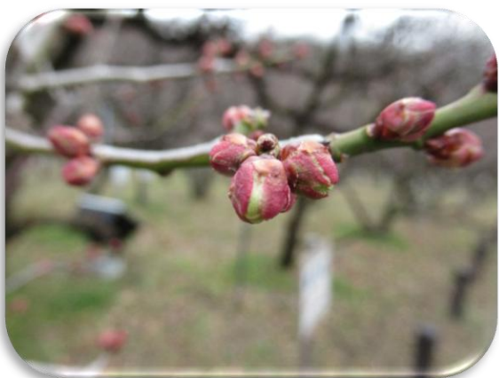
倭冬至(わいとうじ)