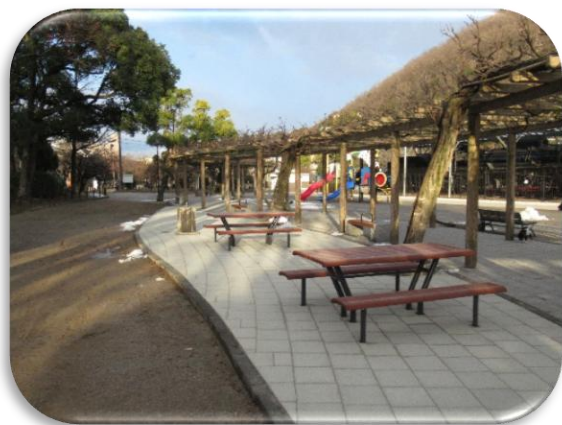
子ども広場ベンチ新設