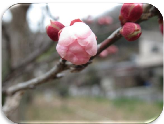
西王母(せいおうぼ)