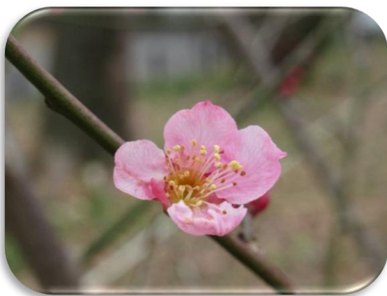
道知辺(みちしるべ)