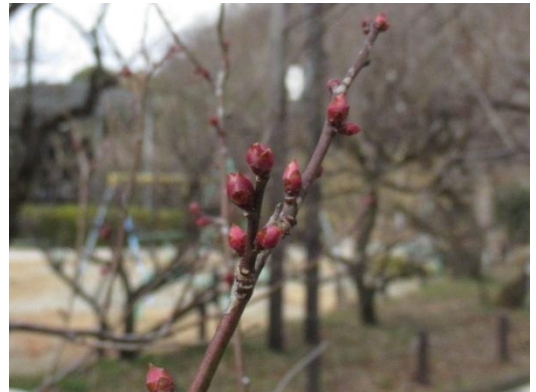
一重寒紅(ひとえかんこう)