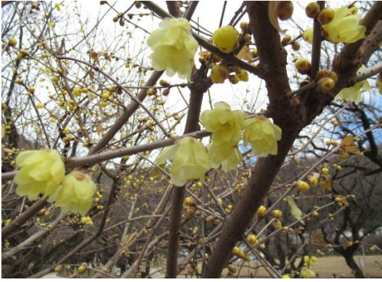
素心蠟梅(そしんろうばい・ロウバイ科)