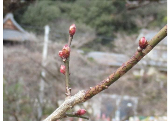
大盃(おおさかずき)