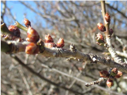
茶青梅(ちゃせいばい)