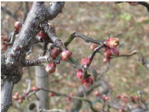
雲竜梅(うんりゅうばい)