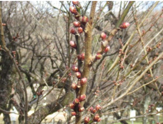
早咲鶯宿(はやざきおうしゆく)