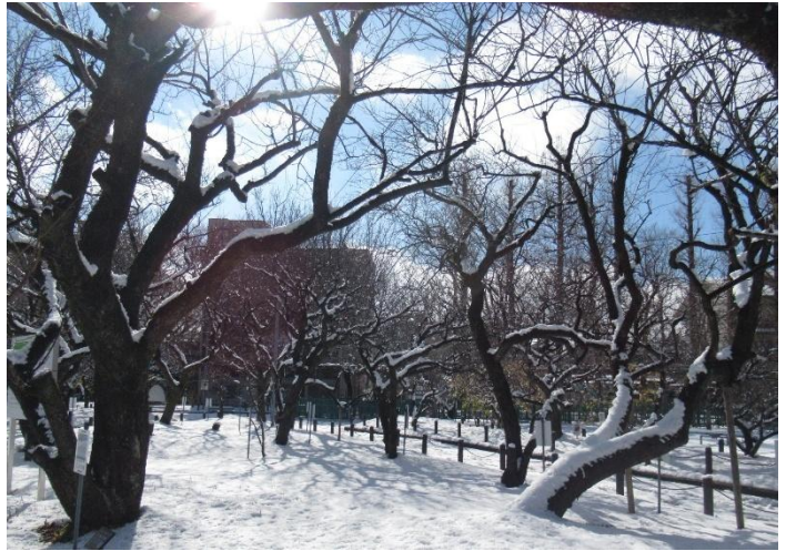
1月10日 岐阜市 積雪 10cm