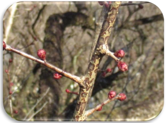
鹿児島紅(かごしまこう)