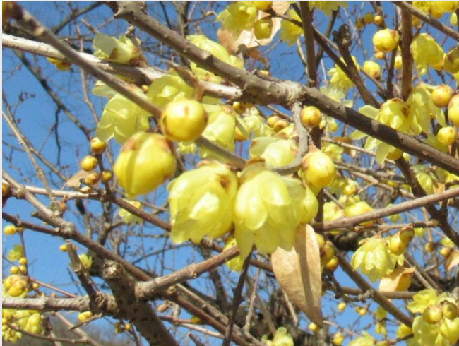
素心蠟梅 (そしんろうばい・ロウバイ科)

素心蠟梅(そしんろうばい:ロウバイ科)はまもなく満開となり見ごろで、周りに甘い香りを放っています。