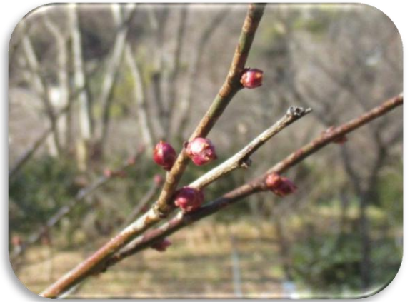
寒紅梅(かんこうばい)