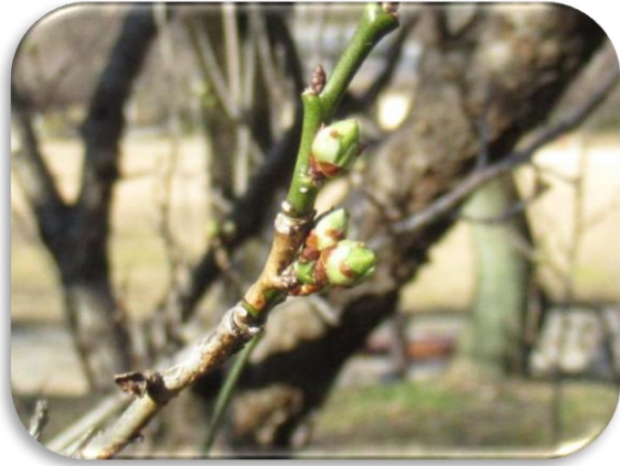
一重緑萼(ひとえりよくがく)