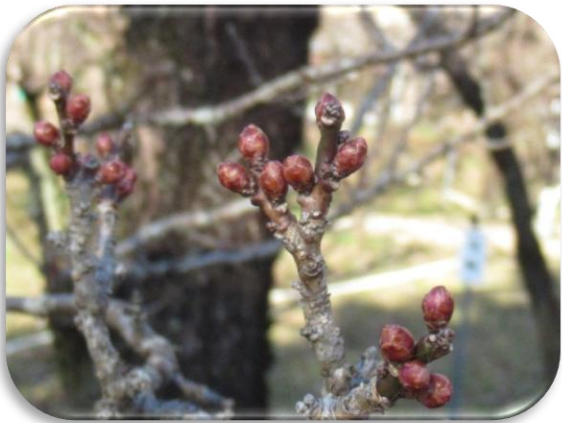
御所紅(ごしよべに)