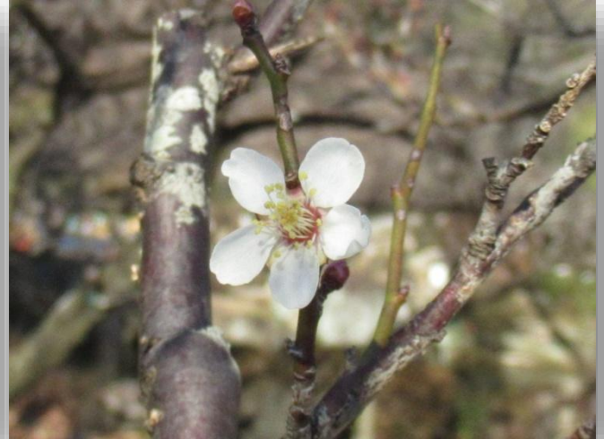
冬至梅 (とうじばい)